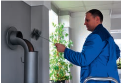
Kehren des Rauchrohrs

Die Wartung des Kaminofens ist naturgemäß abhängig von der Menge an verfeuerten Brennstoff. Grundsätzlich sollte am Ende der Heizsaison das Rauchrohr mit einer entsprechenden Rohrbürste durchgekehrt und Asche ablagerungen an den über der Brennkammer befindlichen Umlenkungen mit einem geeigneten Staubsauger abgesaugt werden. Türdichtungen und Feuerraumauskleidung sollten einer Sichtprüfung unterzogen werden.