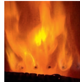
Tertiärluft wird durch Düsen im hinteren Brennraumbereich „eingelassen“

Zusätzlich oder parallel zur Sekundärluft wird den Brennräumen mancher Öfen noch Tertiärluft durch spezielle Düsen im hinteren Brennraumbereich zugeführt. Dies dient einer weiteren Verbesserung der Vermischung von Brenngas und Luft in der Vollbrandphase.