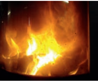
Die Drosselklappe kann geschlossen werden