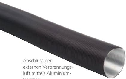
Anschluss der externen Verbrennungsluft mittels Aluminium-Flexrohr