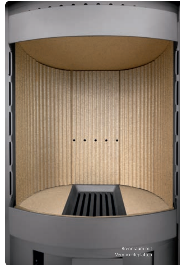
Brennraum mit Vermiculiteplatten

Gerissene Vermiculiteplatten brauchen zunächst nicht ersetzt werden – erst wenn der darunterliegende Metallkorpus frei liegt, muss getauscht werden. Vermiculiteplatten sind asbestfrei und ungiftig.