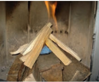
Anzünden mit oberem Abbrand